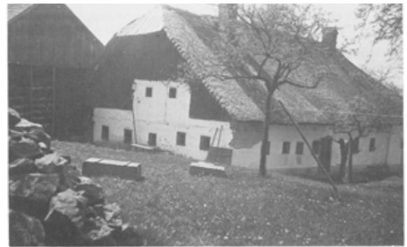
Das Rohrer-Haus vor dem Krieg

Es ist erstaunlich, mit welchem Willen, welcher Opferbereitschaft, mit welcher Bereitschaft zur gegenseitigen Hilfe, diese äußersten Notzeiten überstanden wurden. Bereits am 15. Mai