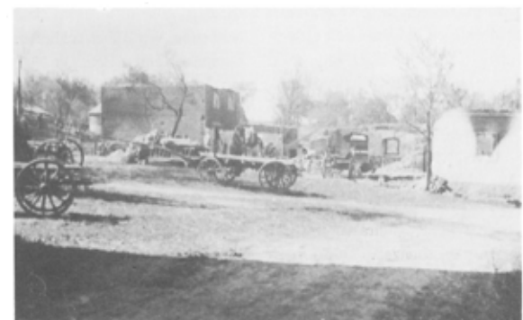
Am Tag danach