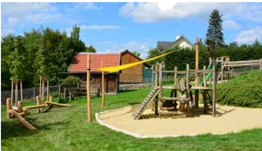
Der Spielplatz des Kindergartens im neuen Glanz

Die vielen Baustellen und in Planung stehenden Bauvorhaben zeigen, dass Prambachkirchen eine Gemeinde ist, in der sich immer viel bewegt. Dadurch bleibt unsere Gemeinde nicht nur ein attraktiver Wohnort, sondern setzt auch aktiv Maßnahmen, um dem allgemeinen Trend der Bevölkerungsabwanderung in Richtung der Ballungszentren entgegen zu wirken.