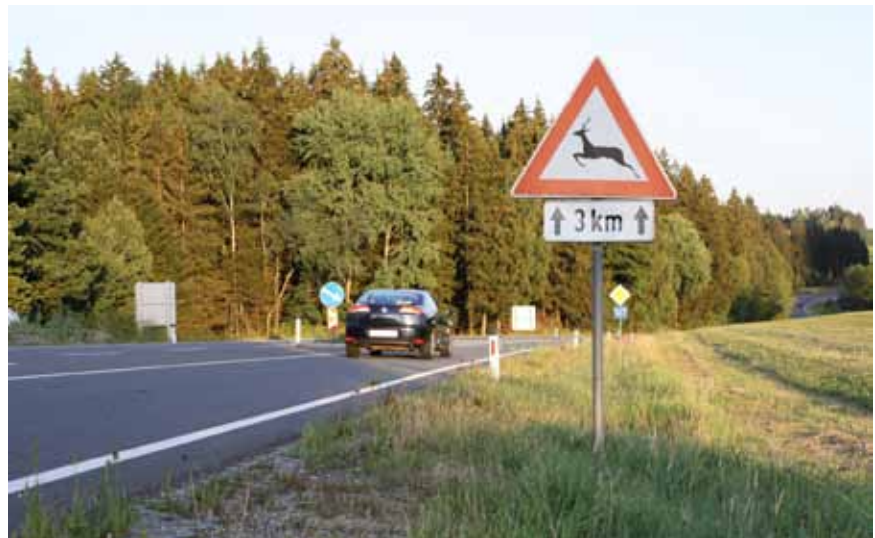
Gerade im Herbst steigt die Gefahr von Wildunfällen

Damit gibt man den Tieren ausreichend Zeit, um aus dem Gefahrenbereich zu