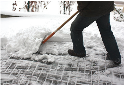
Räum- und Streupflicht im Bereich der eigenen Liegenschaft

Wenn kein Gehsteig (Gehweg) vorhanden ist, ist der Straßenrand in der Breite von 1 m zu säubern und zu bestreuen.