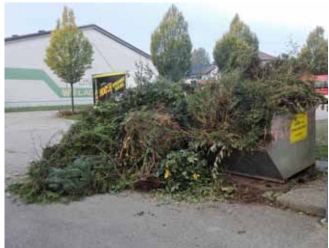
Überfüllte Grün- und Strauchschnitt-Container beim Bauhof