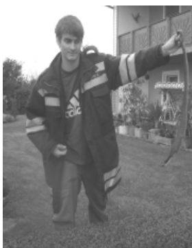
Diese Ringelnatter wurde im Vorzimmer entdeckt.

Die Ringelnatter wurde in einen Stoffsack gegeben und im nahe gelegenen Aschachtal wieder freigelassen.