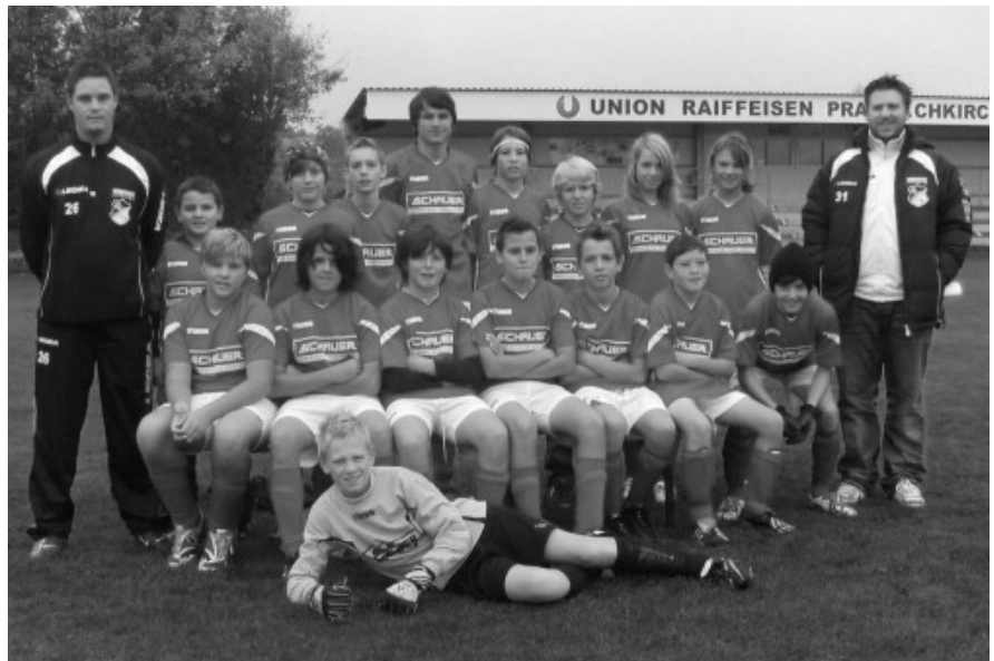
So sehen Sieger aus ...

Infos bzw. Anmeldungen unter gfoellner@prambachkirchen.ooe.gv.at oder 07277-2302-17.