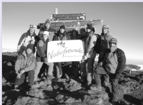
Naturfreunde am Ziel ihrer Träume

Am 14.10.2007 um 6:30 Uhr hatten sie es geschafft. Alle zehn Naturfreunde im Alter von 32 - 62 Jahren standen gemeinsam am Gipfel des 5895m hohen Uhuru Peak, dem höchsten Punkt des Kilimanjaros. Um Mitternacht wurde der Gipfelanstieg bei sternenklarem, aber kaltem und windigen Wetter in Angriff genommen. Der Aufstieg in dieser Höhe machte doch den meisten zu schaffen, was sich durch Schwindelgefühle und Kopfschmerzen bemerkbar machte.