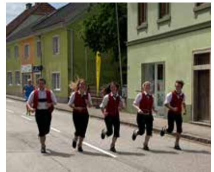
Beim Benefizlauf nicht nur musikalisch am Start sondern auch sportlich

Die nächsten Auftritte sind unter anderem das Erntedankfest am 1. Oktober und die Konzertwertung am 28. Oktober im Bräuhaus in Eferding.