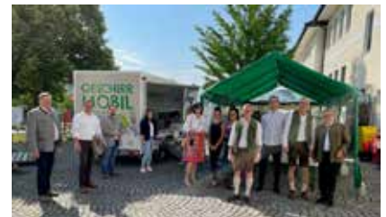
Beim Bezirksmusikfest in St. Marienkirchen kam das neue Geschirrmobil zum ersten Mal in Einsatz