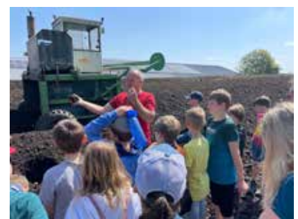
Schüler besuchen die Kompostierungsanlage

„In unserem kontrollierten Kompostierprozess geben wir der Erde nicht nur essenzielle Nährstoffe zurück, sondern schonen die Atmosphäre durch die Bindung von CO 2 im Humus und leisten so einen großartigen Klimabeitrag“, so der Betreiber der Anlage.