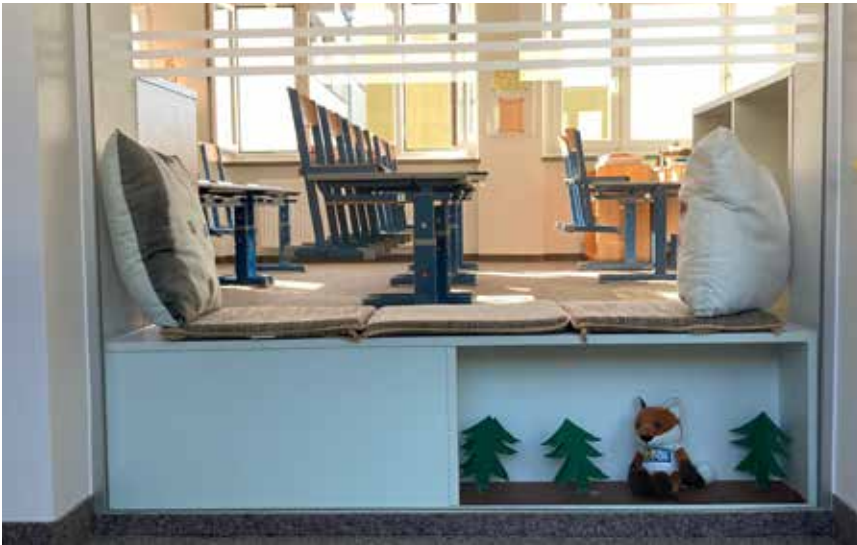
Nett gestaltete Glaslichter

gat auszustatten. Die Investitionssumme von 44.500 Euro wurde in Absprache mit dem Land OÖ in das „Sanierungsprojekt in der Volksschule“ integriert, wodurch sich die Gesamtkosten für die Schulsanierung laut aktuell genehmigtem Finanzierungsplan auf 1.669.728 Euro belaufen.