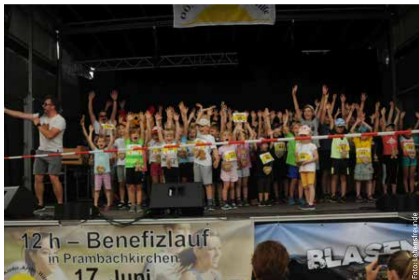
Großer Jubel bei der Siegerehrung vom Kinder-Geschicklichkeitslauf

Auf ein Wiedersehen 2024 freuen wir uns!