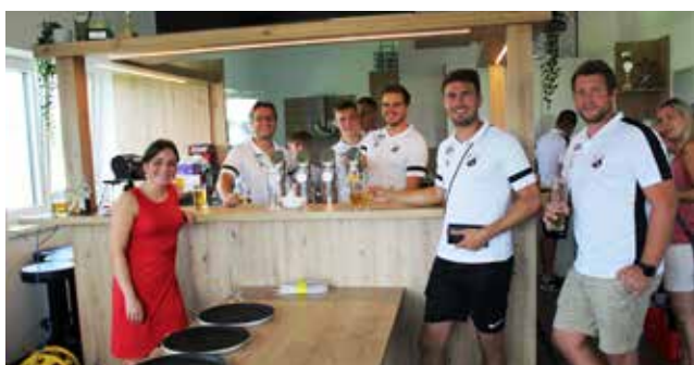
Das Team der Sektion Fußball versorgte die zahlreichen Gäste bestens.