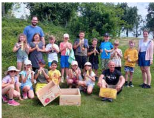
Volksschüler besuchen Imker

Imkerverein Prambachkirchen und kann somit als Vorbild für jeden Jungimker und der es noch werden möchte bezeichnet werden.