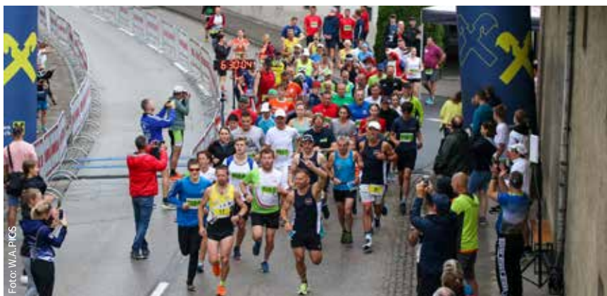
Start des 12h-Benefizlaufes