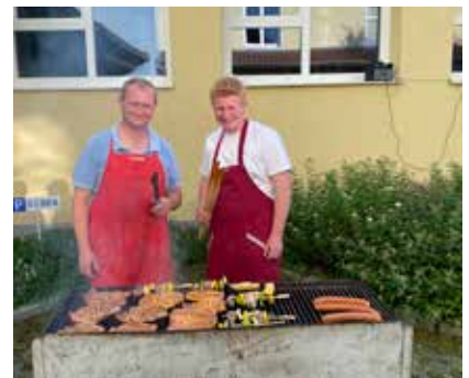
Grillfeier zum Abschluss der Saison