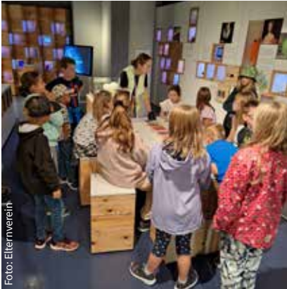
Kinderferienaktion im Ars Electronica Center