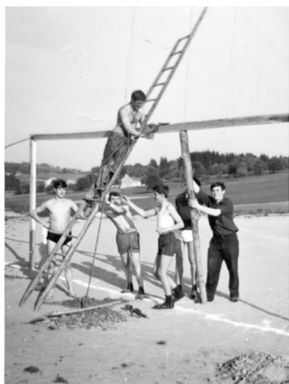
Errichtung der Tore am Schulsportplatz (1979)

Die Topothek ist ein Fenster in die Vergangenheit, das für alle online zugänglich ist. Es soll ein vielseitiges, anschauliches Bild entstehen, wie sich unsere Gemeinde verändert hat, welche Veranstaltungen und Feste stattgefunden haben, wie das Alltags-