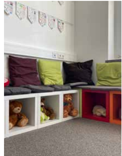
Individuell gestaltete Sitzcken in den Klassenräumen