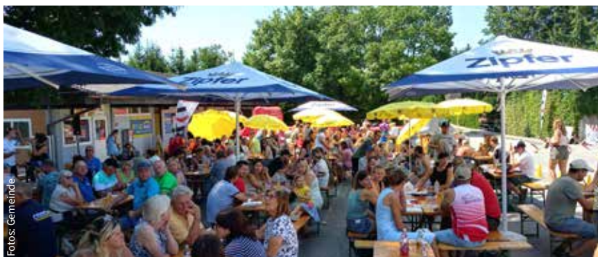
Viele Besucher beim heurigen Sommerfest