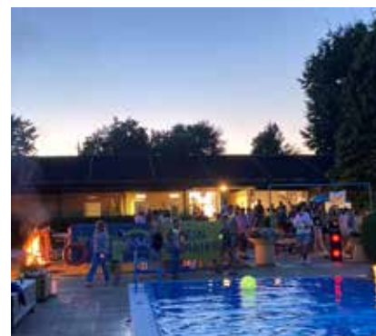
Ein besonderes Highlight im heurigen Sommer – das Mondlichtschwimmen