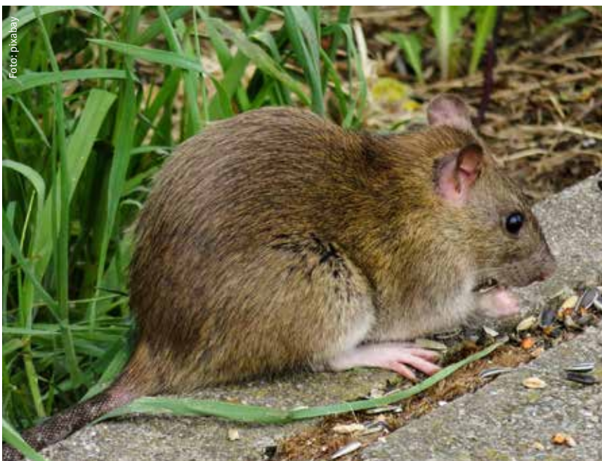
Speisereste sowie Hunde- und Katzenfutter stehen ua. auf dem Speiseplan der Ratten.

Bewahren Sie den Müll nach Möglichkeit bis zur Abholung in unzugänglichen Räumen auf und achten Sie darauf, dass Mülltonnen immer gut verschlossen sind. Futter von Haus- oder Nutztieren, welches für die Nager leicht zugänglich ist, bereichern den Speiseplan von Ratten und Mäusen im Winter. Kontrollieren Sie auch die Umgebung auf mögliche Anziehungspunkte für Mäuse und Ratten und sprechen Sie mit Ihren Nachbarn über das Problem.