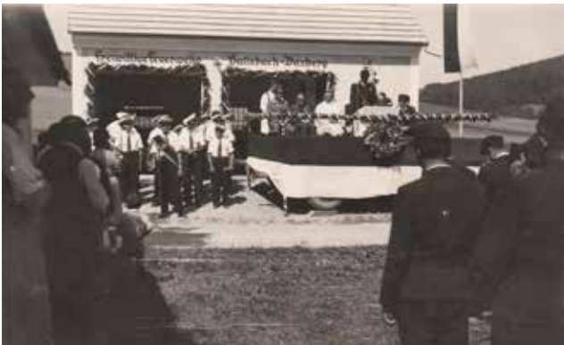
Einweihung des Feuerwehrdepots im Jahr 1955

neten Depots gestartet und eine Tragspritze mit Saugwerk der Firma Gugg angekauft. Nachträglich wurde durch den Wagenmeister von Daxberg ein vierrädriges Gestell für weitere Ausfahrten gebaut. Noch heute ist diese Kutsche im Besitz unserer Feuerwehr.