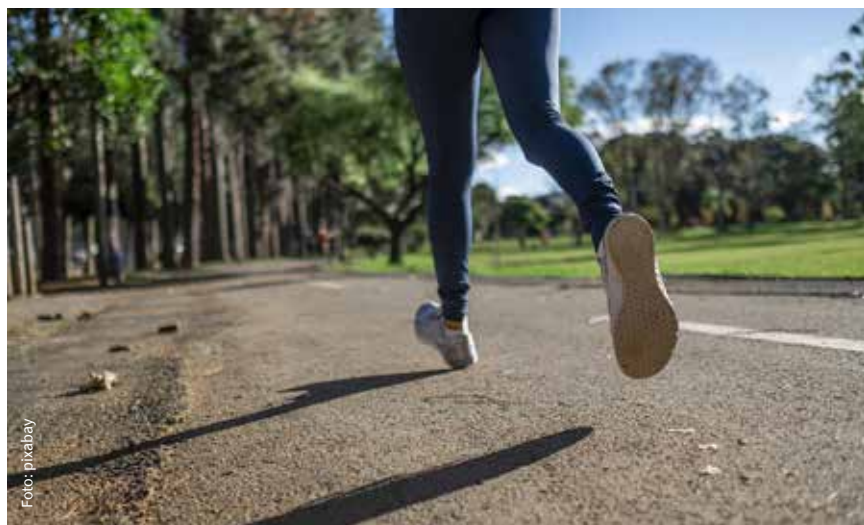
Körperliche Aktivitäten in den Alltag einbauen

Als Faustregel für die mittlere Intensität beim Sport gilt das „Plaudertempo“ – jenes Tempo, bei dem ein Sprechen gerade noch möglich, aber ein Singen bereits unmöglich ist.