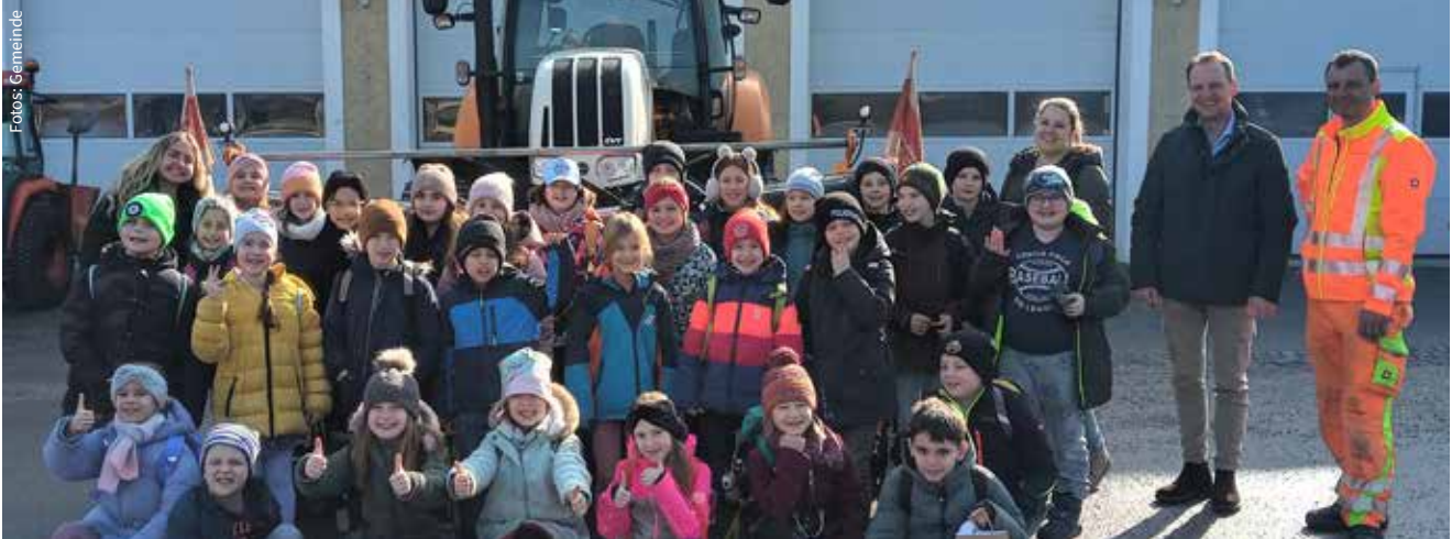
3. Klassen der Volksschule besuchen die Gemeinde

In der 3. Klasse steht unter anderem die Geschichte der eigenen Gemeinde am Lehrprogramm. So durften auch heuer die Schüler der 3. Klasse Volksschule wieder einen spannenden Besuch am Gemeindeamt verbringen. Wie jedes Jahr führte der Ausflug die Kinder in die Welt der Gemeindeverwaltung, um ihnen einen Einblick in die Aufgaben und Tätigkeiten der lokalen Behörde zu geben.