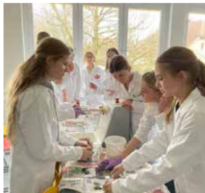
Die neuen Labormäntel im Einsatz

auch bei den Bauhofmitarbeitern und dem Schulwart, die uns gleich die passende Garderobe dazu angefertigt haben und auch für alle anderen Belange immer ein offenes Ohr für uns haben.