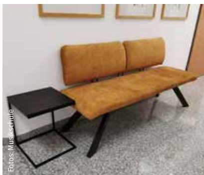
Sitzgelegenheit für den Wartebereich

In den Landesmusikschulen stehen wieder die Schnuppertage ins Haus! Von 24.-28. März können alle Interessierten zu den angegebenen Zeiten die jeweiligen LehrerInnen besuchen und sich einen Einblick in das Musikschulangebot verschaffen. Die Unterrichtszeiten finden Sie auf der Homepage der Landesmusikschulen des Schulverbandes Waizenkirchen. Wir freuen uns auf Ihren Besuch!