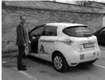
Elektroauto für die Energiegenossenschaft Region Eferding

Die Energiegenossenschaft Region Eferding eGen hat ihr erstes E[F] mobil in Betrieb genommen. Es handelt sich dabei um ein Elektroauto, das von mehreren Nutzern gefahren werden kann. Zielsetzung ist, wenig genutzte Zweit- oder Drittautos zu ersetzen. Dadurch können sich die künftigen Nutzer enorme Kosten sparen, dennoch mobil sein und die Umwelt entlasten, denn das geplante Fahrzeug wird mit Ökostrom betrieben. Eferdinger Betriebe unterstützen dieses Projekt finanziell. Weitere Standorte sind bereits geplant in Alkoven, Buchkirchen, Fraham, Hartkirchen, Hinzenbach, St. Marienkirchen und Scharten. Wenn Sie Interesse an einer Teilnahme in einer dieser Gemeinden haben, ersuchen wir um Kontaktaufnahme. Details zur Nutzung eines Autos finden Sie unter www.energiegenossenschaft.at .