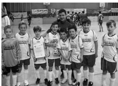
U10 wurde Hallen-Bezirksmeister 2015

Kinder und Jugendliche sind jederzeit an unseren Trainingseinheiten willkommen.