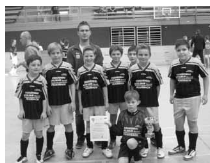
U11 wurde 3. bei der Hallen-Bezirksmeisterschaft