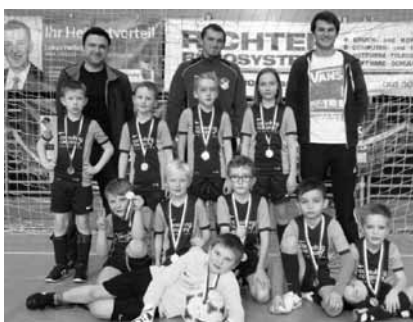
U9 errang den 2. Platz bei der Hallen-Bezirksmeisterschaft und den Sieg beim Hallenturnier in Waizenkirchen